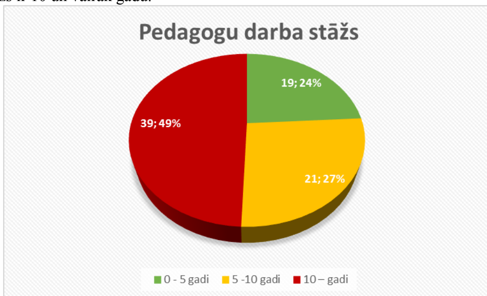
attēls nr. 2 pedagogu darba stāžs

Skolā strādā pieredzējuši un profesionāli pedagogi. No 79 pedagoģiskajiem darbiniekiem 75 ir augstākā pedagoģiskā izglītība, 45 ir maģistra grāds, savukārt 5 pedagogi ir ieguvuši doktora zinātnisko grādu. Pedagoģiskā personāla sastāvs ir noturīgs, daudzi pedagogi savu pieredzi nodod tālāk saviem bijušajiem audzēkņiem, kuri studējot vai pēc studijām ir izvēlējušies strādāt Skolā kā pedagogi. Katru gadu Skolā darbu uzsāk vairāki jaunie pedagogi (šobrīd 3 pedagogi ir JVLMA bakalaura programmas studenti), bet 39 pedagogu pedagoģiskā darba stāžs ir 10 un vairāk gadu.